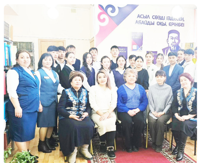
фото-архивтердің тарихын тарамдады. Аудандық кітапханада «Сирек кітаптар – құнды мұра» атты мектеп оқушыларына арналған кітап көрмесі ұйымдастырылды.

Апталықтың кезекті күні «Кітап.Тарих. Шежіре» сирек және құнды, ерекше кітаптар күніне арналды. Кітапханашылар «Қалба тынысы» газетінің редакциясына аудан мектептерінің оқушыларымен саяхат жасап, ардагер журналистермен кездесті. Газет тігінділерімен танысып,